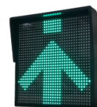
Individuele traffic light incl. zonnescherm